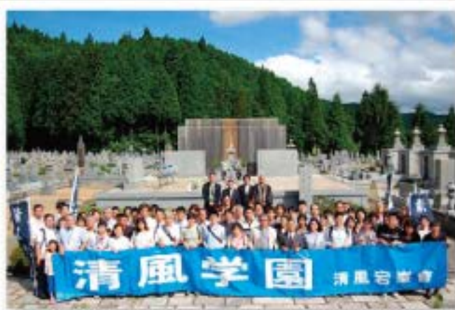
思い出の高野山修養行事交流会 平成24年7月15日開催