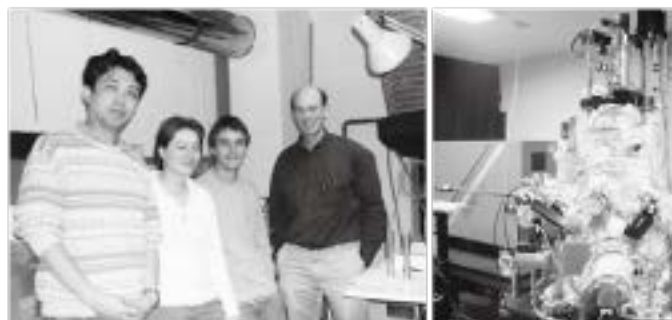
ドイツの研究グループと共同研究の様子 機能性酸化物合成装置

画期的な発見はしばしば「偶然」や「幸運」という言葉で語られますが、実際は、研究者がしっかりとした価値観と信念をもち、加えて、失敗しても諦めずに挑戦し続けた結果です。これらの能力は、研究だけでなく、おそらく他の分野でも求められることでしょう。清風高校の教育でこのような素養をもった多くの人材が輩出されることを期待しています。