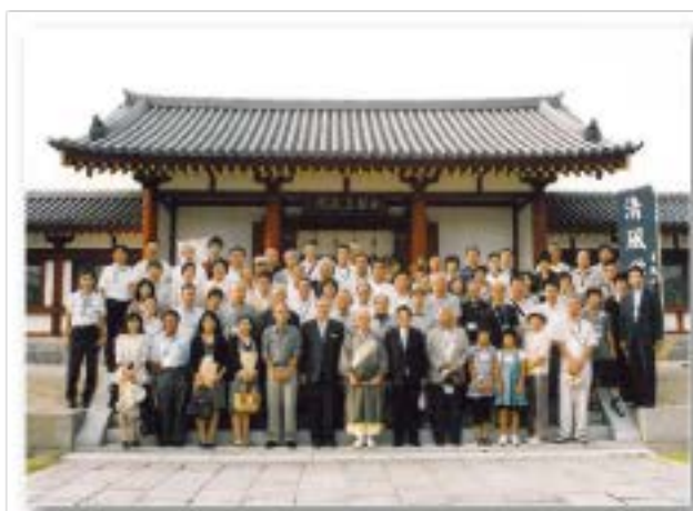
会員交流事業「秋の薬師寺での集い」 平成22年9月11日 開催