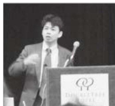
国際会議での成果発表の様子

研究では、どのような方法で解答に辿り着くことが出来るのか、そもそも解答が存在するのかわからない問題に挑戦します。一方、教育(特に、大学院教育)では、研究を通じて、世界の第一線で活躍できる研究者を養成します。具体的には、基礎知識にもとづいて独自の思考回路をもち、さらに論理的に物事を進めることができるよう指導します。実際の研究と教育には覚悟にも似た信念が必要です。研究は未知への挑戦ですので、研究内容によっては極めて厳しい環境に置かれることがあります。2011年、「準結晶の発見」によりイスラエル工科大学のシェヒトマン博士にノーベル化学賞が授与されました。準結晶とは結晶でも非晶質でもない固体のことです。研究を発表した当初は、あまりに非常識な結果のため周囲に認められず、当時所属の研究グループを去るようにも通達さ