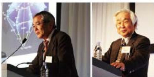
益川敏英先生（京都産業大学教授）・右 根岸英一先生（米バドュー大学特別教授）・左

2012年2月25日、ノーベル賞受賞者を囲むフォーラムが清風学園にて開催されました。ノーベル賞受賞者を囲むフォーラムは読売新聞社が主催し、1988年より様々な場所で開催されてきました。そして、今回は「科学の未来、探求する心」というテーマについて、2008年ノーベル物理学賞を受賞した益川敏英先生（京都産業大学教授）、2010年ノー