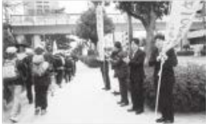
出発を見送る清風宕峯会の会員たち