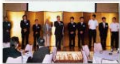
清風岩峯会総会で クラス会・クラブOB会