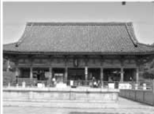
四天王寺 石の鳥居と六時堂