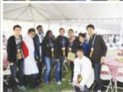
世界の舞台で研究発表する生徒たち