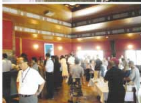
「秋の薬師寺での集い」の様子とレストランテ・アムリット