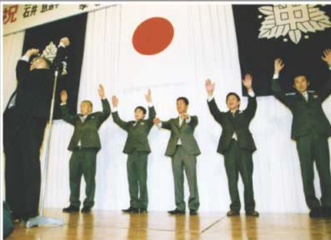
祝勝・慰労会で万歳（10月17日シェラトン都ホテル大阪）