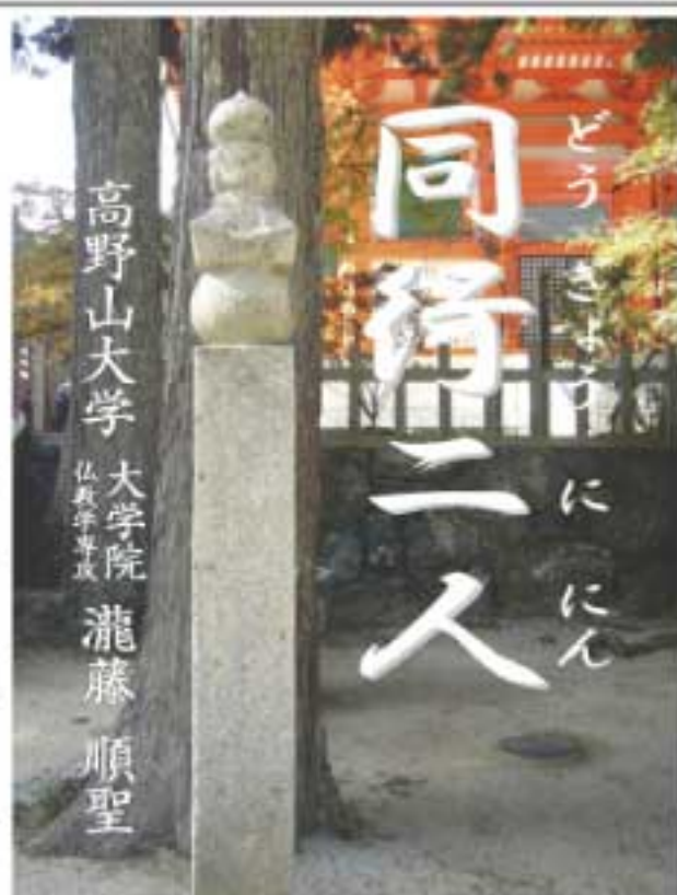
高野山大学 大学院 瀧藤 順聖 弘法大学堂