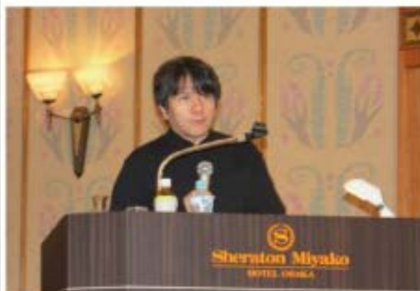
テーマ「国際社会の中での日本」 ～アベノミクス成長戦略の今後を占う～