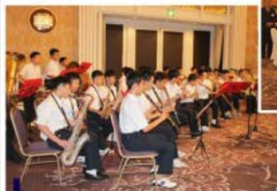
● 清風学園プラスバンド部による演奏