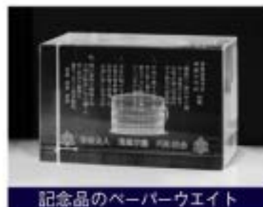
記念品のペーパーウエイト