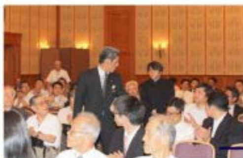
● 記念講演として、 宮崎哲弥氏をお迎え