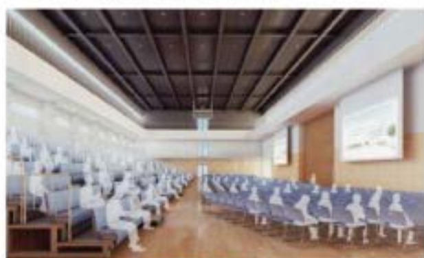
アリーナ(多目的ホール) 座席使用時

可動式の壁面収納座席590席を含め、最大1,500名を収容できる多目的ホールです。