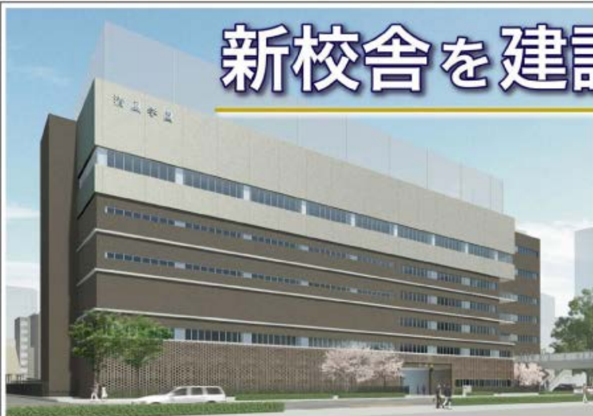
▲新校舎完成イメージ

総床面積9,700㎡を超える地上6階建て、新たな清風学園の「顔」となる新校舎の建設が進んでいます。本学園の教育方針を体現する施設として、随所に独自の工夫を凝らした校舎が間もなくお目見えします。