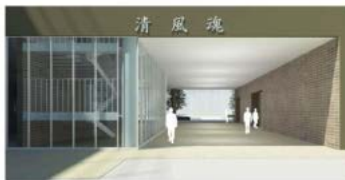
エントランス(北面 グラウンド側より)

本学園の教育理念の真髄である「徳・健・財」が南側に、「自利利他」の精神を育てていきます。