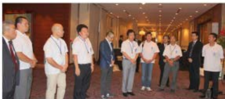
● 岩峯会役員の様子

懇親会 記念講演会 総会 18時〜20時(浪速の間) 17時〜(大和の間) 16時〜(大和の間)