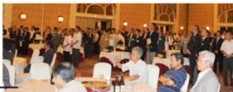
● 懇親会会場の様子

「みんな集まれ！清風大同窓会」が会員交流事業として、平成25年7月13日シエラトン都ホテル大阪に於いて盛大に開催しました。 清風岩峯会が、10周年を迎え記念講演として、宮崎哲弥氏をお迎えし、テーマは「国際社会の中での日本」～アベノミクス成長戦略の今後を占う～という内容でご講演いただきました。 政権が、民主党から自民党に代わり、安倍政権がアベノミクスを掲げ日本の舵を取るようになってから半年余りが過ぎ、国税庁や財務省等のデータをもとに今までの経過、現状を解説していただきました。今後、消費税が5%から8%に変わるとどうなるのか、前回消費税が上がった時のデータをもとに、海外の税金を比較し、長期金利から見た日本経済の方向性、経済成長率、物価指数、為替などの変動を見ながらこれからの経済がどのように動いていくのか詳しく説明していただきました。