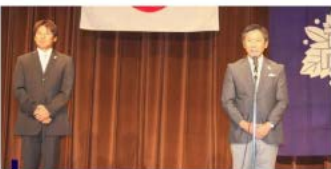
● オリンピックに出場された 具志堅幸司氏(右)と池谷幸雄氏