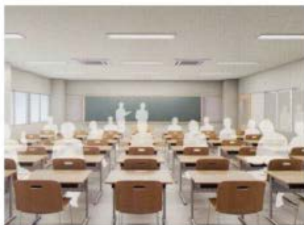
教室 ゆとりをもって勉強に取り組める空間づくりを心掛けました。