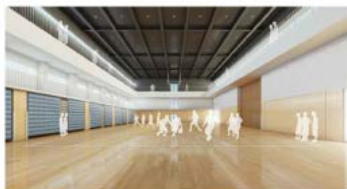
アリーナ 座席収納時

可動式の壁面収納座席590席を含め、最大1,500名を収容できる多目的ホールです。