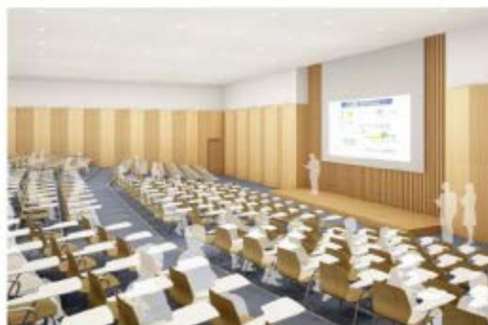
レクチャーホール ステージに向かって緩やかな勾配をつけた聴講席を設置した多目的ホールです。