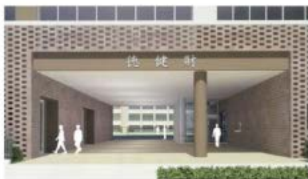
エントランス(南面 道路側より)

本学園の教育理念の真髄である「徳・健・財」が南側に、「自利利他」の精神を育てていきます。