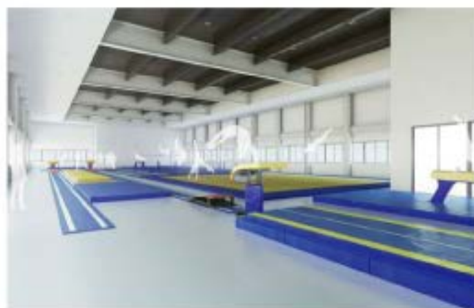
体操場 国内でも屈指の規模・内容を備えた、体操・新体操用の競技施設です。