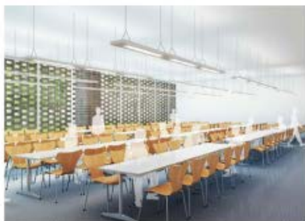
食堂 透かしレンガのスクリーン壁から差し込む柔らかな自然光が、明るい空間をつくれます。