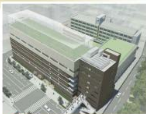
▲上空からのイメージ

I期工事（東側半分）は平成27年春、II期工事（西側半分）は平成28年秋に完成予定です。