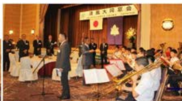
● プラスバンド部の 演奏で校歌斉唱